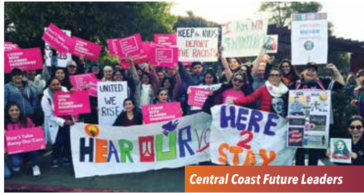
Central Coast Future Leaders