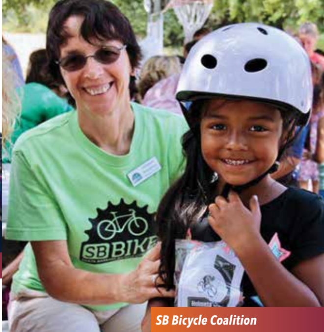
SB Bicycle Coalition