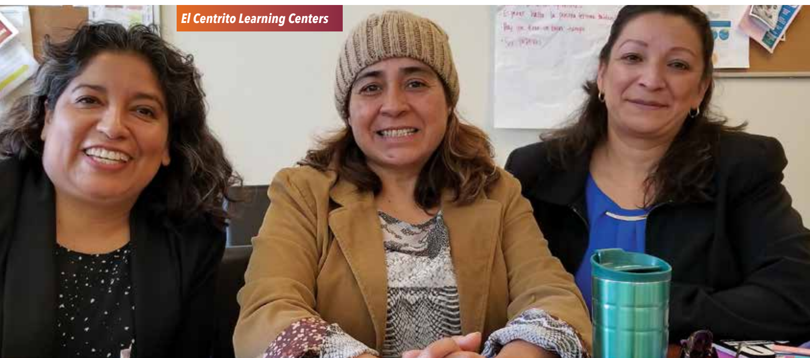
El Centrito Learning Centers

LGBTQ sensitivity trainings provided to police officers, schools, nursing homes, and other agencies. Entrenamientos de sensibilidad LGBTQ proporcionados a oficiales de policía, escuelas, hogares de ancianos y otras agencias.