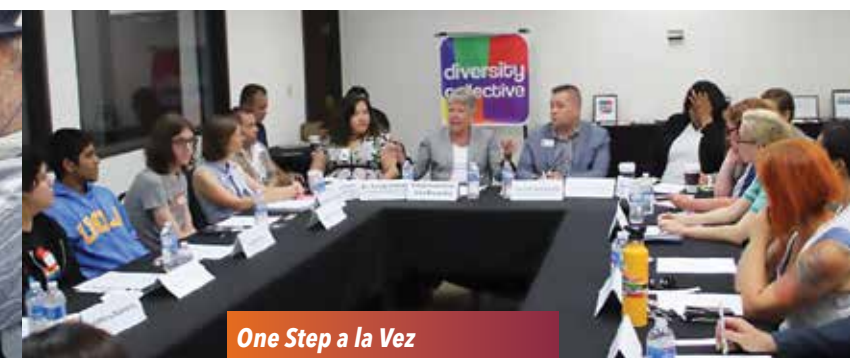
One Step a la Vez