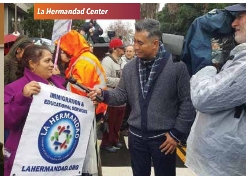
La Hermandad Center