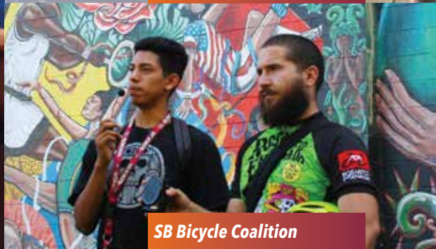
SB Bicycle Coalition