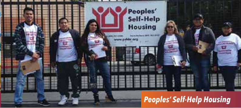
Peoples' Self-Help Housing