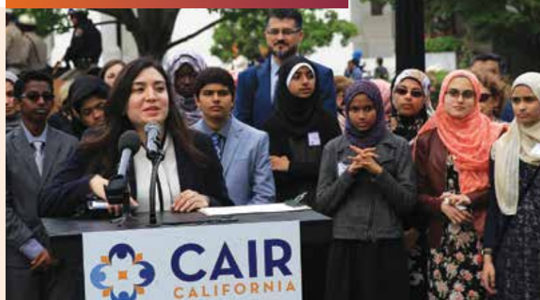
Council on American-Islamic Relations

for youth leadership and advocacy programs to empower youth in the Santa Maria Valley to become more active leaders in their homes, schools, and communities.