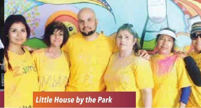
Little House by the Park